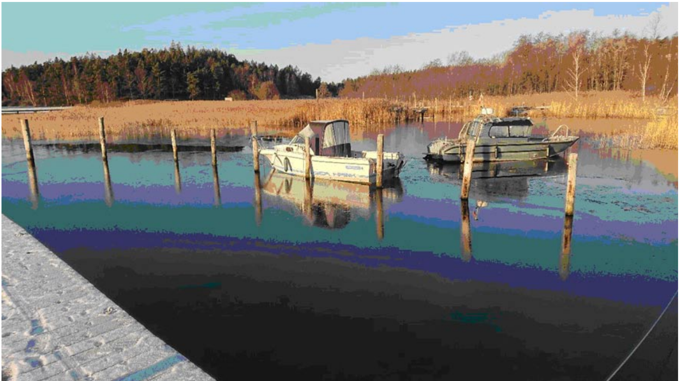
Två båtar på drift efter att motorerna stulits och båtarna knuffats ut i vattnet.