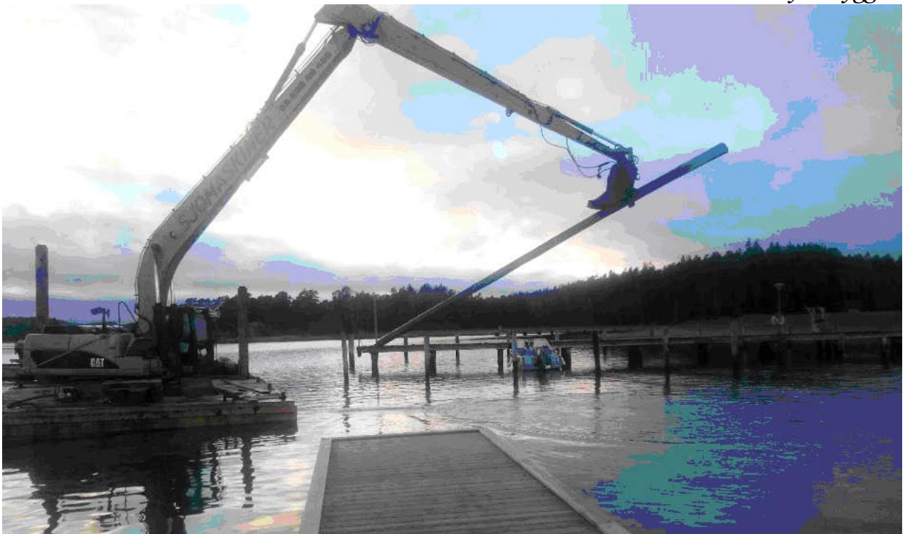
Sjömaskiner lyfter bort